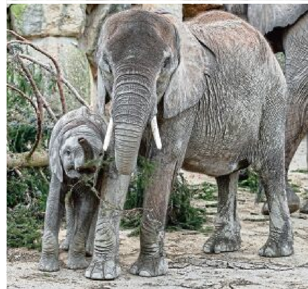
Bekommen sie mehr Platz? Ein mögliches neues Elefanten-Gehege wurde zum Politikum

Marihilf. Im Richard-Waldemar-Park im 6. Bezirk mussten sieben Zierkirschen gefällt werden. Der im ersten Moment etwas eigen-tümlich anmutende Grund: Die an sich robusten Bäume hätten dem „Stress der Stadt nicht standgehalten“, berichtet die Wiener Bezirkszeitung . Kälte, Hitze, Autoabgase, Hunde-Urin und Streusalz seien ihnen zum Verhängnis geworden, die Stadtgärtner mussten sie fällen. Bald sollen neue Bäume gepflanzt werden: Die Wahl fiel auf Judasbäume – nicht nur wegen der schönen Blüten, sondern auch, weil sie besonders pflegeleicht sind.