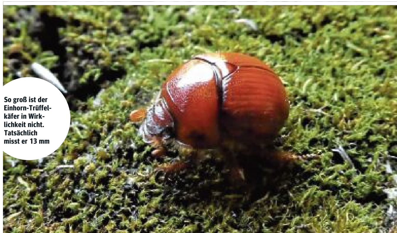
So groß ist der Einhorn-Trüffelkäfer in Wirklichkeit nicht. Tatsächlich misst er 13 mm

S1. Während Umweltschützer ein seltenes Insekt ins Spiel bringen, hofft ein Unfallforscher auf den Bau des Lobautunnels